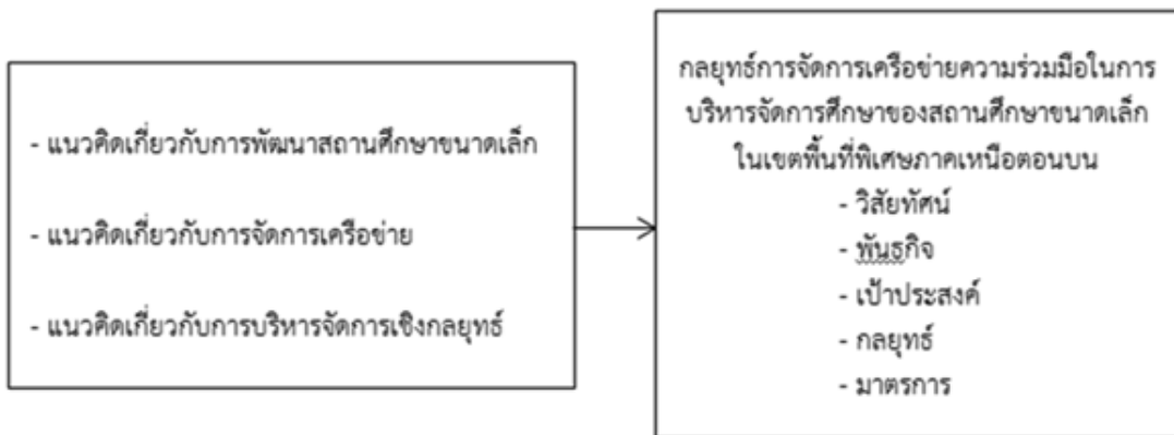
ภาพที่ 1: กรอบแนวคิดในการวิจัย